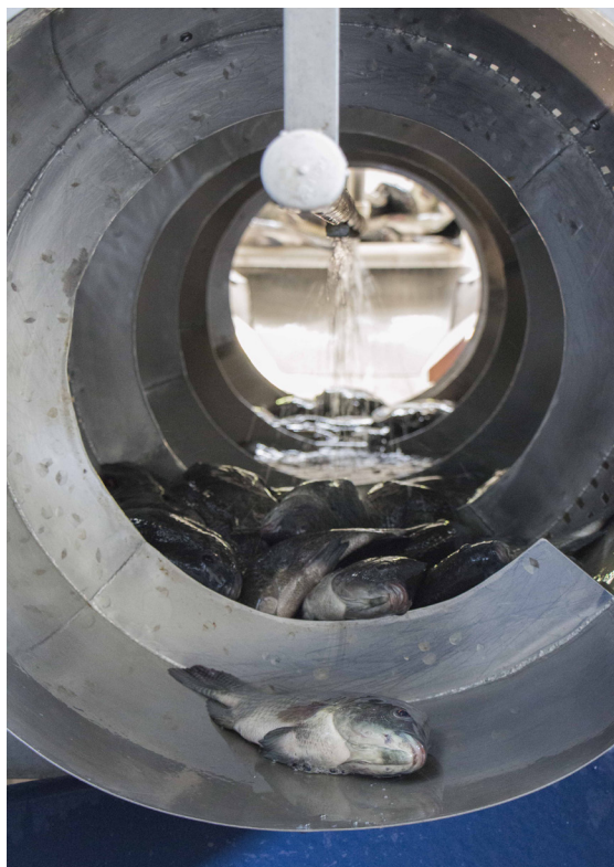
Figura 6. Cilindro de lavagem para higienização do peixe (passagem da área suja para área limpa).