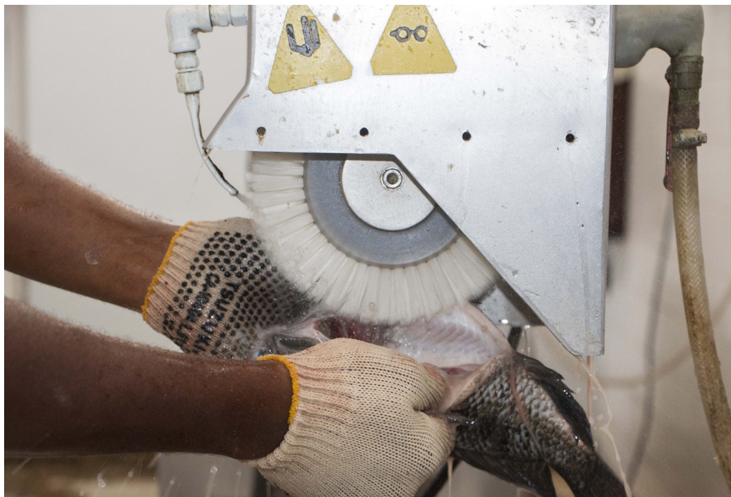
Figura 8. Lavagem e escovação da parte ventral do peixe após evisceração e antes da filetagem.

Segundo Bykowski e Dutkiewicz (1996), a cabeça, parte não-comestível da tilápia, constitui de 10% a 20% do seu peso total. O descabeçamento, manual ou mecanizado, reduz as chances de proliferação de micro-organismos, além de diminuir o peso do produto, com consequente redução nos custos com transporte e espaço para estocagem (Lins, 2011).