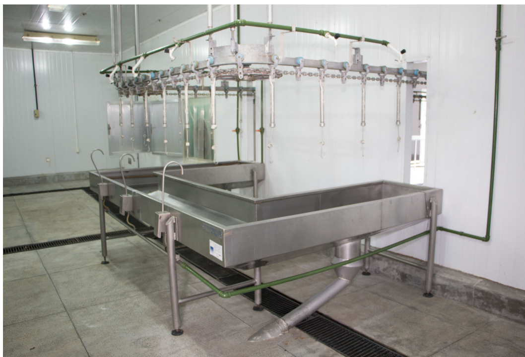
Figura 4. Área limpa industrial, onde ocorre a retirada da pele e eventração das rãs.

O passo seguinte é a evisceração, ou seja, a retirada das vísceras do animal. No caso do aproveitamento de vísceras, como o fígado, deve-se ter cuidado para não romper a vesícula biliar. Outro aproveitamento comum é o corpo adiposo, que também deverá ser retirado e encaminhado para setor responsável nessa etapa do abate. Separa-se cabeça e vísceras da carcaça, e realiza-se a toailete, ou seja, a retirada comercial de partes indesejáveis no produto final, por meio da secção da extremidade dos membros e eliminação de tecido dilacerado. A seguir, ocorre o acondicionamento em embalagens individuais e o congelamento rápido do produto final em equipamentos específicos e aprovados pelo serviço de inspeção. O armazenamento dos produtos é feita sob estrados plásticos, a uma temperatura de -23\text{ }^{\circ}\text{C} .