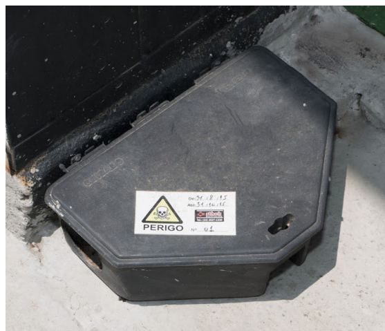
Figura 6. Armadilha para controle de vetores e pragas.

Faz-se necessário, na aplicação do controle químico, o estabelecimento de procedimentos pré e pós-tratamento a fim de evitar a contaminação dos alimentos, equipamentos e utensílios – que antes de serem reutilizados, devem ser higienizados para a remoção dos resíduos dos produtos desinfestantes (Agência Nacional de Vigilância Sanitária, 2014).