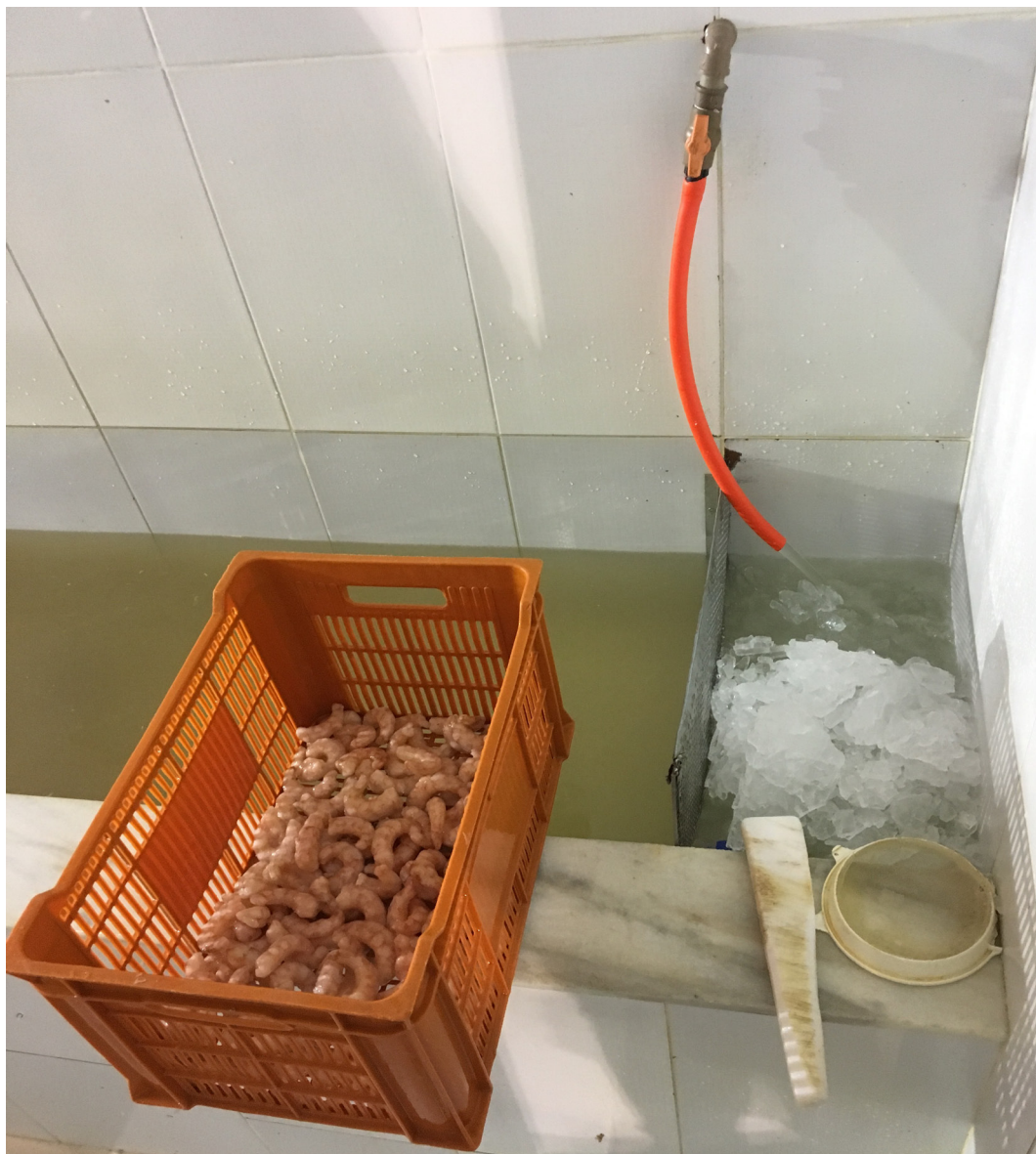
Figura 13. Camarão antes do glaciamento.

O único aditivo discriminado pelo regulamento técnico para camarão congelado é o metabissulfito de sódio e ressalta-se que deve constar na rotulagem uma expressão que declare o emprego desse aditivo para orientação ao consumidor (Brasil, 2010).