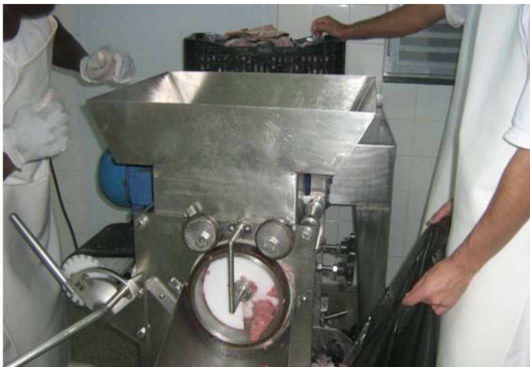
Figura 2. Máquina de desossa mecânica com cilindro e tambor, a carne desossada é recolhida na parte frontal da máquina e na lateral os resíduos são recolhidos em saco plástico preto.