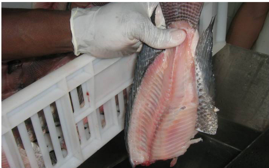
Figura 1. Espinhaço de tilápia após filetagem pronto para introdução na máquina de desossa mecânica.