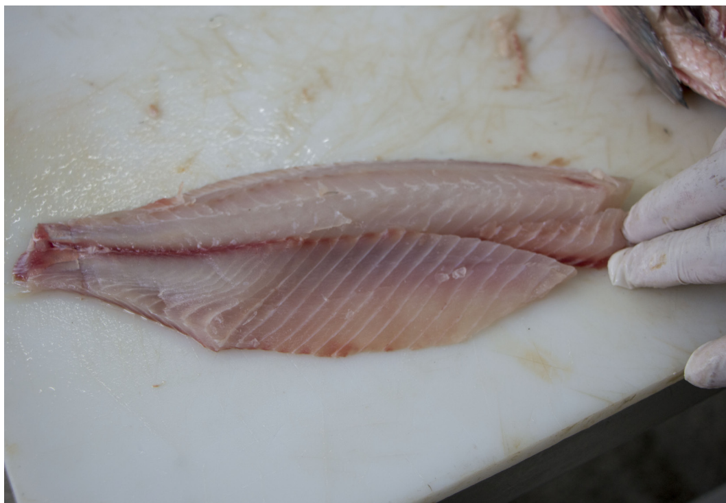
Figura 11. Filé de tilápia finalizado, já com aparas comerciais realizadas.

Após a filetagem, os filés são novamente lavados com água hiperclorada para remoção de resíduos das operações anteriores.