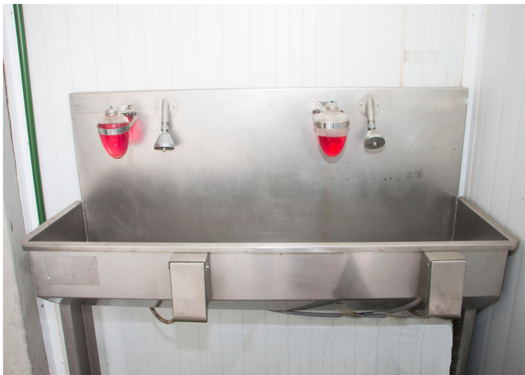
Figura 4. Lavatório para higienização de mãos e antebraços na barreira sanitária (entrada para área de processamento).