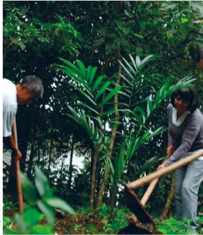
HORTA ECOLÓGICA, JARDIM BOTÂNICO DE SANTOS