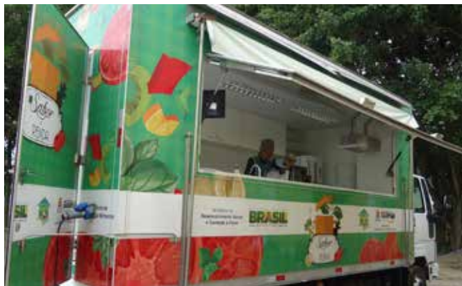
PROGRAMA SABOR E RENDA, GUARUJÁ

A Política de SAN em seus diferentes níveis de governo vem sendo concretizada por meio de uma melhor articulação da rede operacional, dos programas e das ações voltados para diferentes aspectos da segurança alimentar e nutricional, paralelamente à implementação do sistema de ação política – conselho municipal, conferência e órgão intersecretarias.