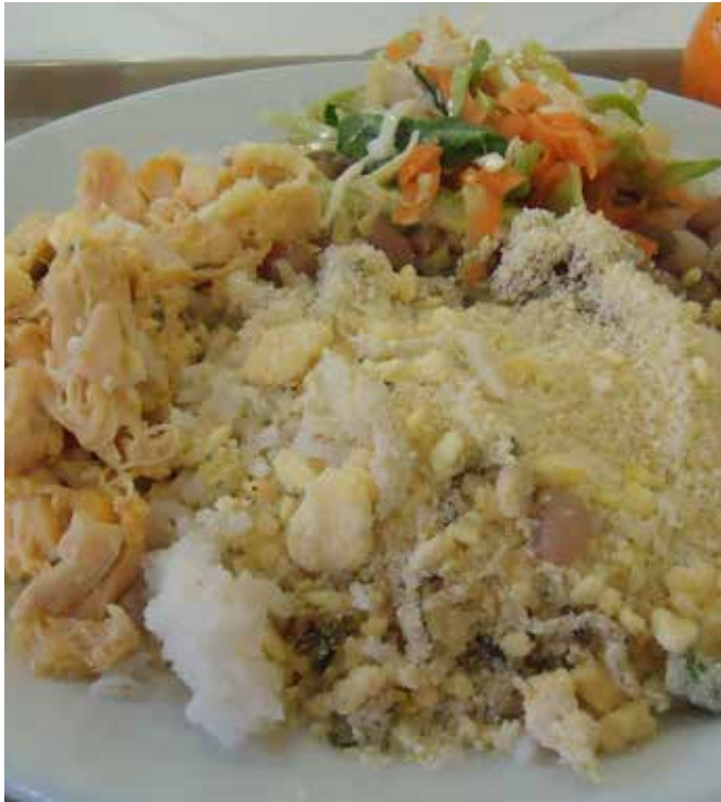
PROGRAMA SABOR E RENDA, AULA DE CULINÁRIA, GUARUJÁ

O Observatório Litoral Sustentável elaborou um mapa interativo com os elementos que compõem o sistema de segurança alimentar e nutricional na Baixada Santista. O mapa mostra no território os equipamentos de acesso ou de aquisição de alimentos, como restaurantes populares, banco de alimentos, mercados públicos e feiras livres, bem como feiras organizadas por produtores e por pescadores artesanais para venda direta ao público. O mapa apresenta também a localização das organizações de produtores da agricultura familiar, os produtos que oferecem e a forma de contato, que podem ser acessadas pelo poder público e por compradores institucionais, como hotéis e restaurantes e, eventualmente pela população em geral. Mostra, ainda, o perfil de cada município em relação à SAN, desde os órgãos responsáveis pela gestão da política de segurança alimentar até os programas existentes, equipamentos de acesso e aquisição de alimentos.